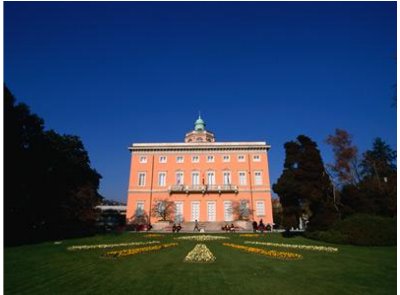
صورة للقصر في داخل الحديقة فيلا كياني Villa Ciani